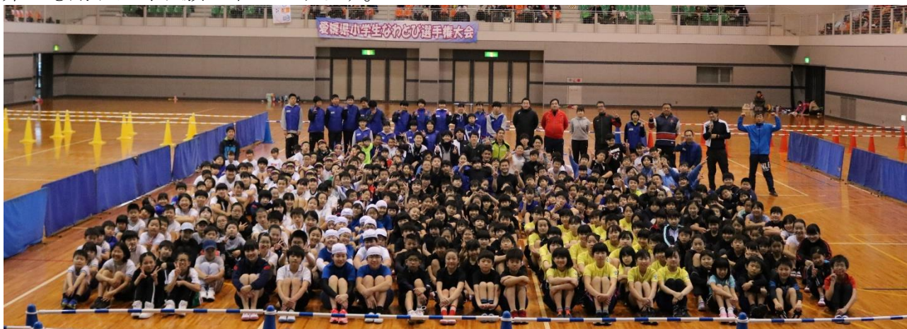
※第5回愛媛県小学生なわとび選手権大会にて

愛媛県なわとび協会では、大会パンフレットへの協賛広告、応援メッセージを募集しています。第5回大会は令和3年1月31日（日）に大洲市総合体育館にて行います。本大会は、選手の日頃の練習の成果を発揮する場として、また、親子や家族のコミュニケーションを図る場として開催しております。県内各地から400名を超える選手がエントリーし、個人種目と団体種目で競い合います。本大会の開催主旨をご賢察いただき、大会が盛大に開催できますよう、広告ご協賛を是非とも賜りたくお願い申し上げます。