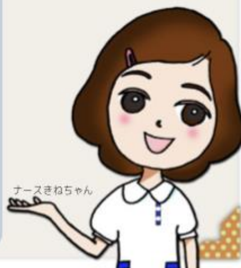
ナースきねちゃん