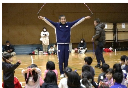
【JUMP ROPE FESTA 2025】