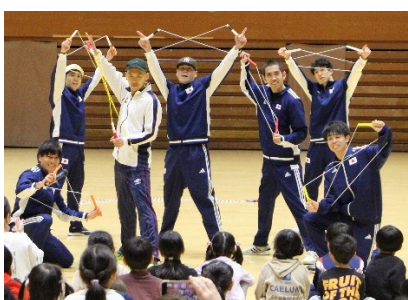
【FC今治戦パフォーマンス】