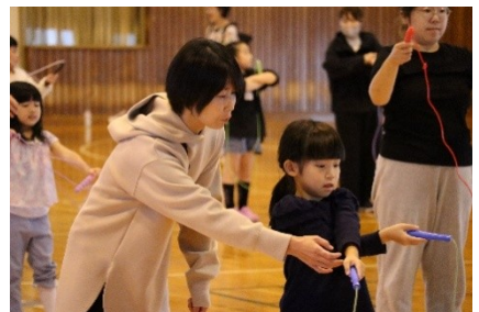
【必ず跳べるようになる! なわとび教室】