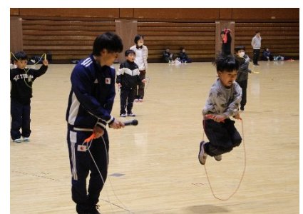
【大洲ロータリークラブ杯】